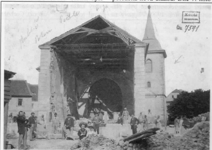
Kostel po vybourání západního průčelí, 2. červen 1899 (muzeum Hořice)

bořeno západní průčelí. Po vykopání základů nových zdí se začalo s vlastní přístavbou, zhruba dokončenou 19. července. Zbořena byla vnější schodiště vedoucí na galerie, zazděna stará a vybourána nová okna. Do konce léta byla postavena i nová střecha a pod ní teprve pomalu a rozvážně stavěli zedníci a kameníci novou klenbu. Interiér byl hotov koncem října, 30. října byla položena nová dlažba. Dne 7. listo-