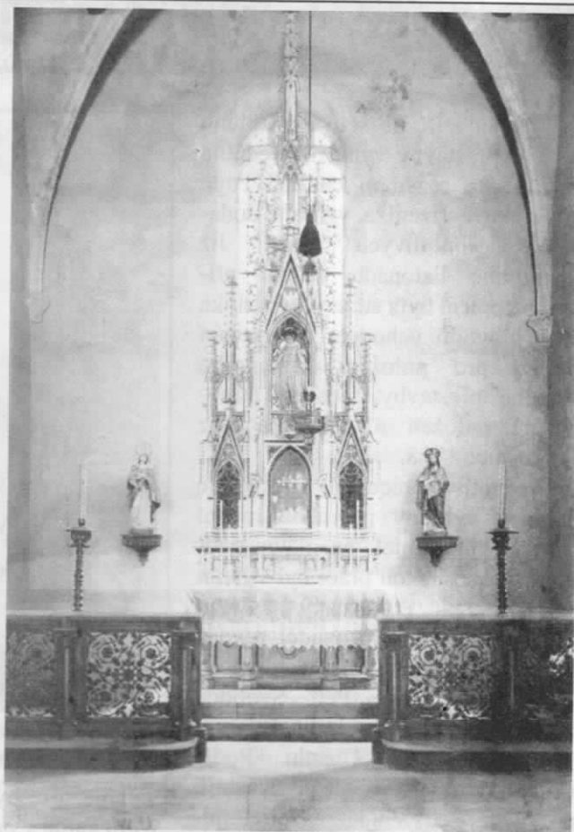
Snímek presbytáře před přestavbou v roce 1898 a presbytáře asi z roku 1902

padu dostala nová sanktusová vížka pozlacený kříž a o posvěcení 12. listopadu byla nová kostelní loď poprvé otevřena veřejnosti. První mše se sloužila u prozatímního oltáře ve východním rohu, místo varhan posloužilo farářovo harmonium.