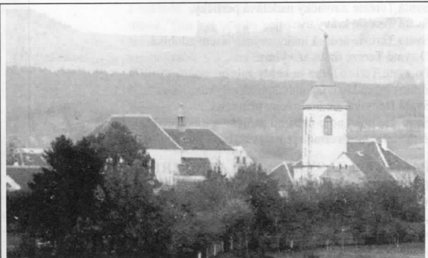
Miletínský kostel v roce 1892

Spolupráce hořické sochařsko-kamenické školy byla pro celou