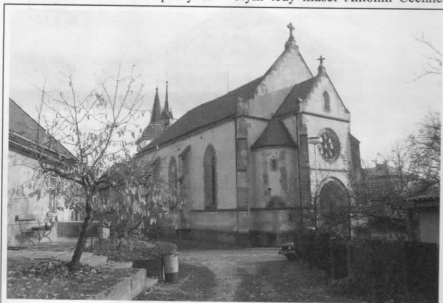
Miletičský kostel z 1. listopadu 2008

Počínaje 14. květnem instalovali pracovníci firmy Emanuel Štěpán Petr z Prahy – Žižkova na kůru nové varhany. O májové pobožnosti 25. května se na ně poprvé veřejně hrálo. Presbytář zatím dostal novou omítku a dlažbu. V této fázi rekon-